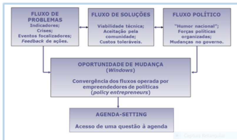
Figura 1: Modelo de Fluxos Múltiplos de Kingdon

Embora o relevante papel dessas comunidades, destaca-se que isso não é suficiente para que um tema entre na agenda, já que, no modelo de Kingdon (2011), sua formação é resultado da convergência de três fluxos: de problemas, de soluções e político. Em seu modelo de Fluxos Múltiplos, Kingdon (2011) preocupa-se basicamente com os estágios pré-decisórios: a formação da agenda ( agenda-setting ) e as alternativas para a formulação das políticas. A figura 1 ilustra o esquema: